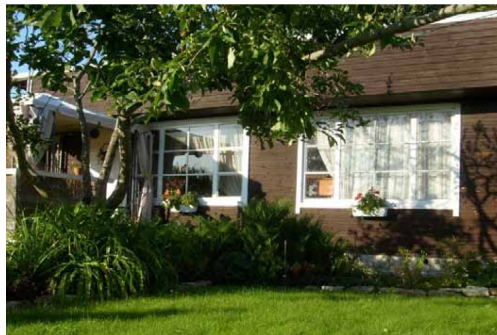
Suvila Ida-Virumaal Toila alevikus

Narva kinnisvaraturg on üldiselt loid, vaid üüriturg on elavam.