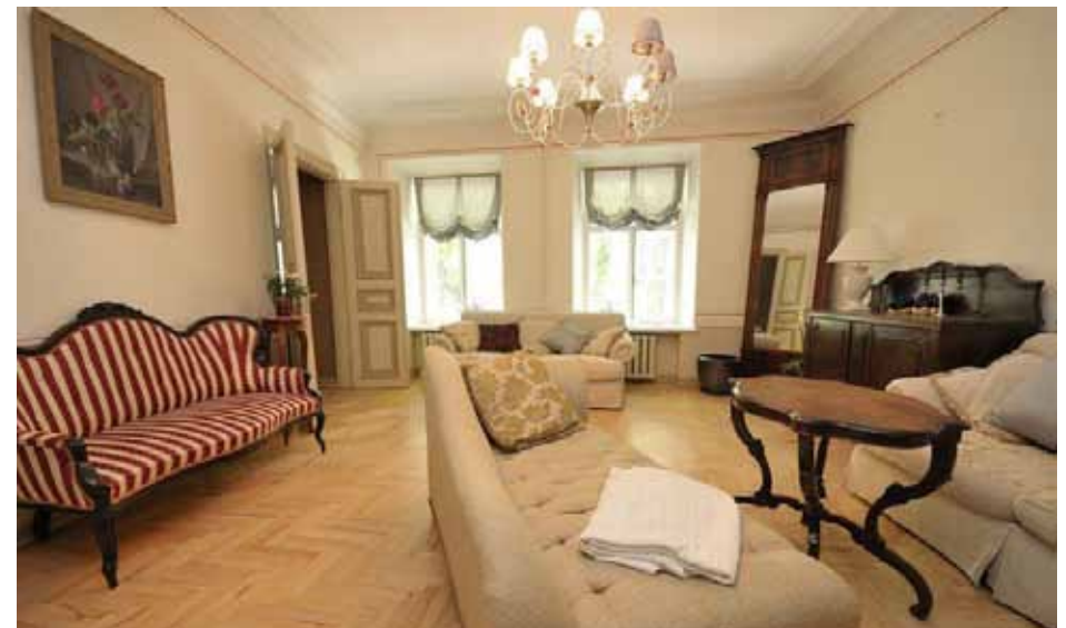
4-toaline korter Tallinna vanalinnas Pikk tänaval