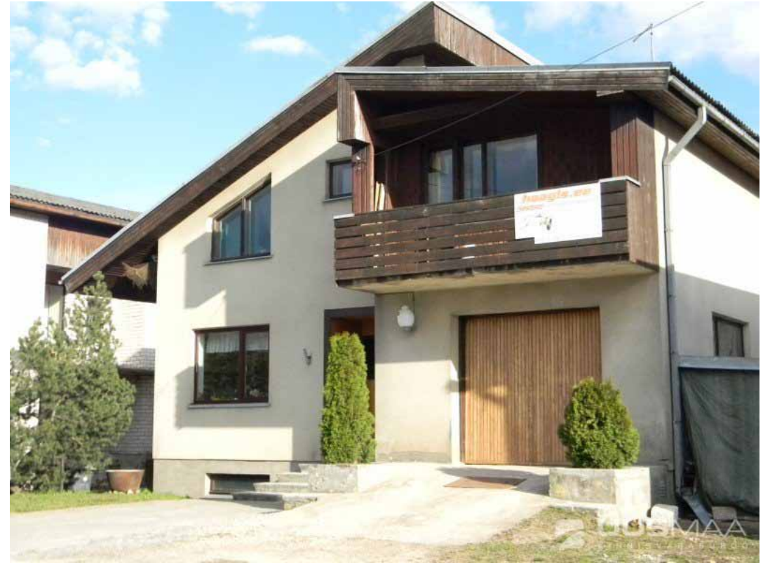
Eramu Viljandi aedlinna piirkonnas Rehe tänaval.