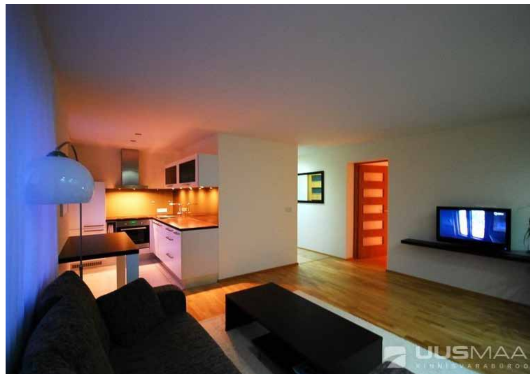
2-tooline korter Pärnus Mai tänaval.