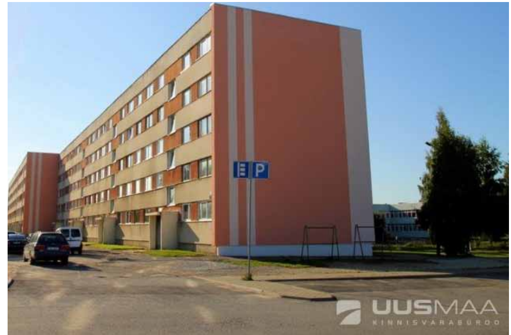
Renoveeritud korterelamu Võrus Vilja tänaval.