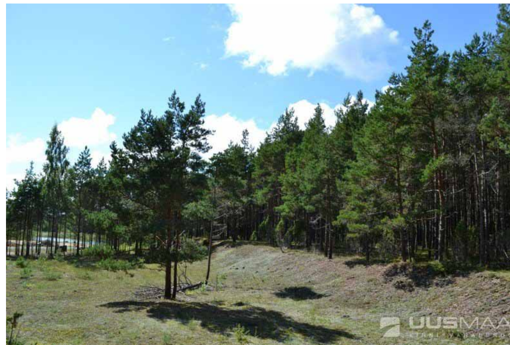
Krunt Saaremaal Salve vallas, ca 13 000m 2 .